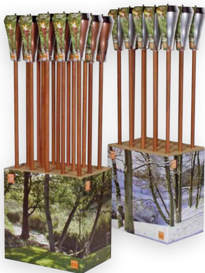
Alle faklene leveres med display med vintermotiv på to av sidene og sommermotiv på de to andre sidene