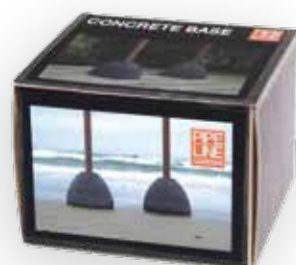
Betongfot i emballasje