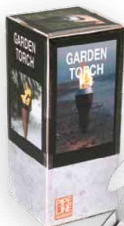
Knockdown-fakler kommer i en eksklusiv gaveeske